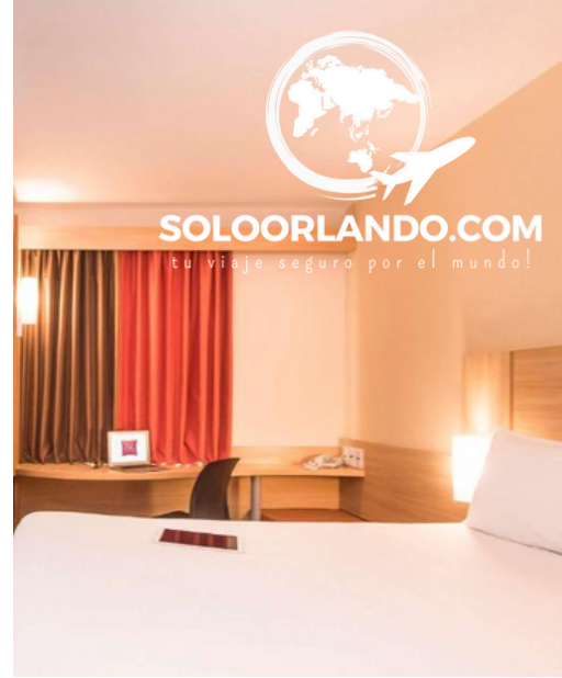
IBIS LARCO HOTEL - LIMA (o similares)