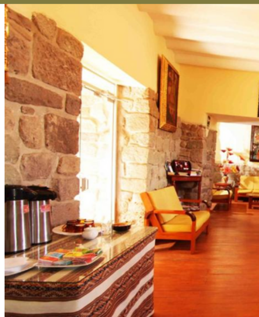
HOTEL SIETE VENTANAS - CUSCO (o similares)