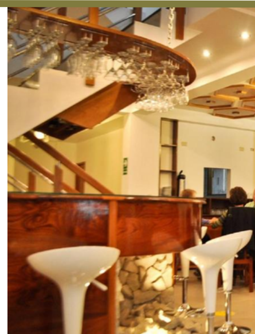
HOTEL FLOWER'S HOUSE - MACHU PICCHU (o similares)